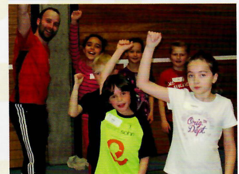
SCV-Kids-Tag und SCV trifft KiTa: Jede Menge Kinder nahmen die Angebote an